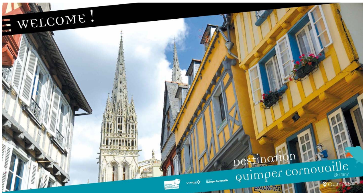
Bâche de promotion de la « Semaine anglaise » de la Destination à l'aéroport de Quimper Cornouaille