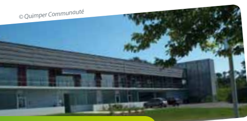
© Quimper Communauté L'hôtel d'entreprises de Quimper Communauté

Sur 2 000 m 2 ce bâtiment situé à Créac'h Gwen accueille depuis 2001 des activités tertiaires émergentes ainsi que des structures d'accompagnement des entreprises : la technopole Quimper Cornouaille, la boutique de gestion, l'ADIE, Bretagne Active.