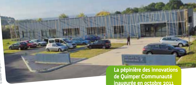
La pépinière des innovations de Quimper Communauté inaugurée en octobre 2011