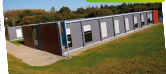
© Communauté de communes du Pays de Quimperlé