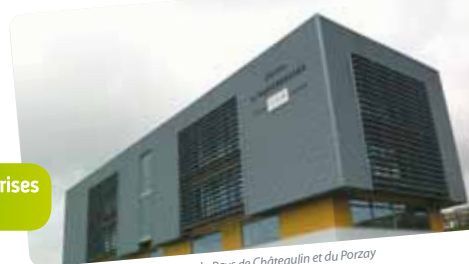
© Communauté de communes du Pays de Châteaulin et du Porzay