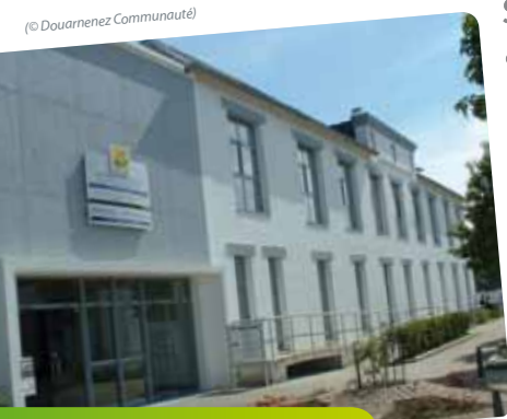
La pépinière d'entreprises de Douarnenez Communauté

Contact : pepiniere@douarnenez-communauté.fr Tél. : 02 98 75 51 50