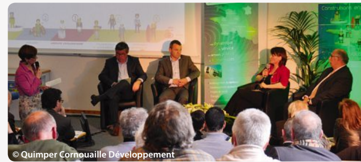
5 e rendez-vous de la Cornouaille : table ronde « Une Cornouaille productive »

Le 11 avril 2013, plus de 200 personnes de tous horizons ont pris part à cet événement qui visait à faire connaître le scénario de référence. Des tables-rondes traitant des thématiques les plus emblématiques du scénario de référence ont été préférées à une restitution intégrale. Des élus, des chefs d'entreprises ou de projets, des experts et praticiens ont illustré les problématiques et enrichi les approches. Une brochure rend compte in extenso de la démarche prospective, du scénario de référence et de la richesse des échanges. Un deuxième document dégage, quant à lui, une synthèse du scénario. Ces documents sont téléchargeables sur : www.quimper-cornouaille-developpement.fr > Projets-de-territoire > Cornouaille-2030 et sur www.facebook.com/Cornouaille2030