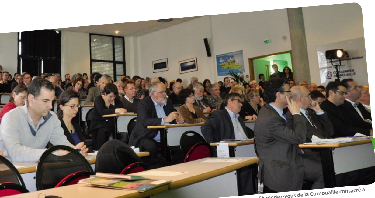
Plus de 150 personnes ont participé à la démarche prospective Cornouaille 2030 et 200 personnes au 5 e rendez-vous de la Cornouaille consacré à la présentation du scénario de référence

Cette assemblée consultative territoriale est composée d'une quarantaine de personnes réparties en quatre collèges qui représentent la société civile : entreprises et vie économique ; organisations syndicales ; vie collective et associative ; personnalités qualifiées. A la demande du président de Quimper Cornouaille Développement, le Conseil de développement peut être appelé à donner son avis sur les projets et stratégies élaborées pour le Pays.