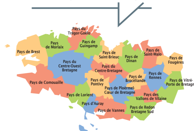
Réalisation Conseil régional de Bretagne – 2014