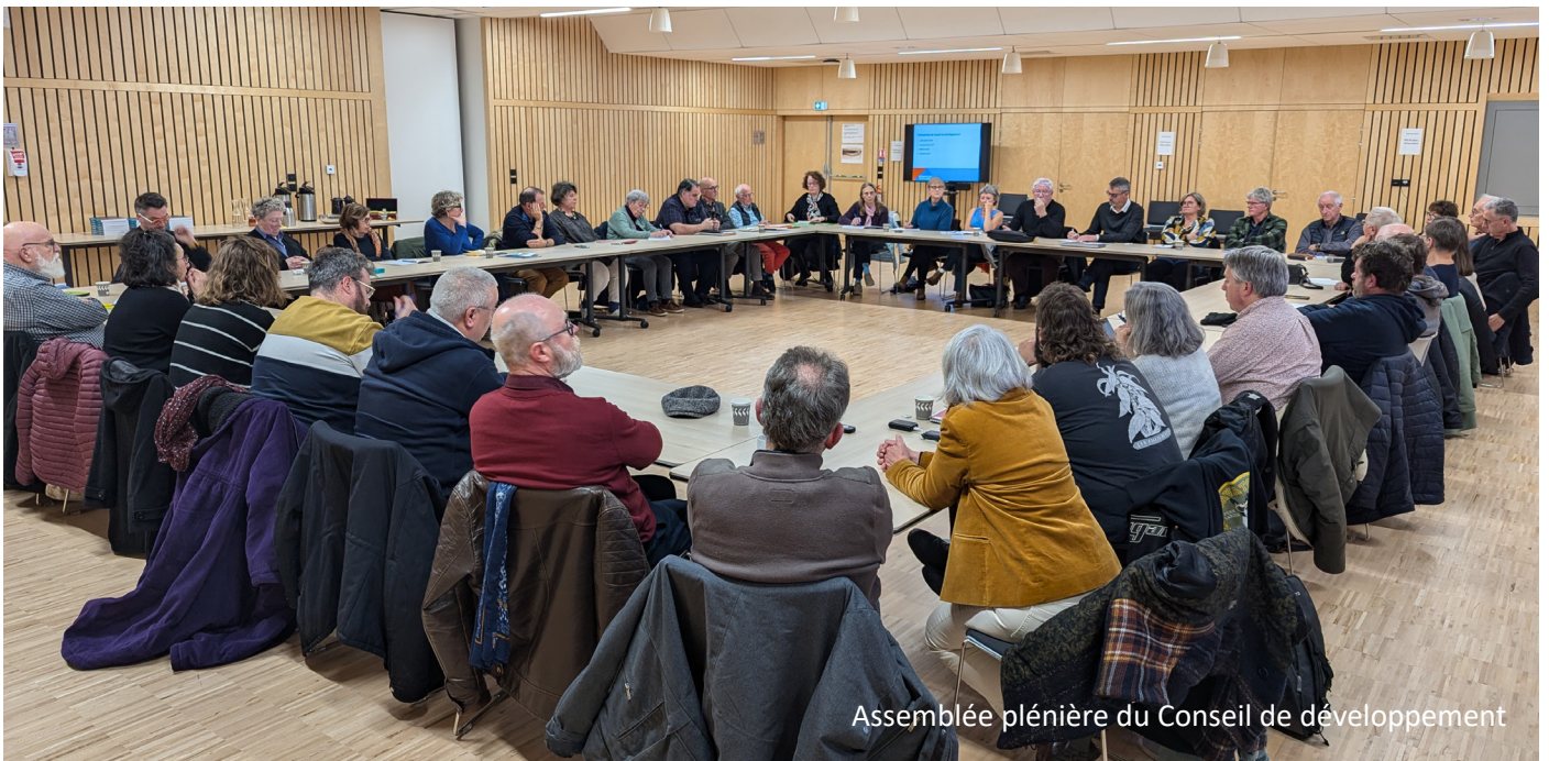
Assemblée plénière du Conseil de développement

Cette nouvelle Assemblée poursuivra bien entendu les travaux initiés précédemment, et permettra également d'explorer de nouvelles thématiques dont les bénévoles du CDC souhaiteront s'emparer.