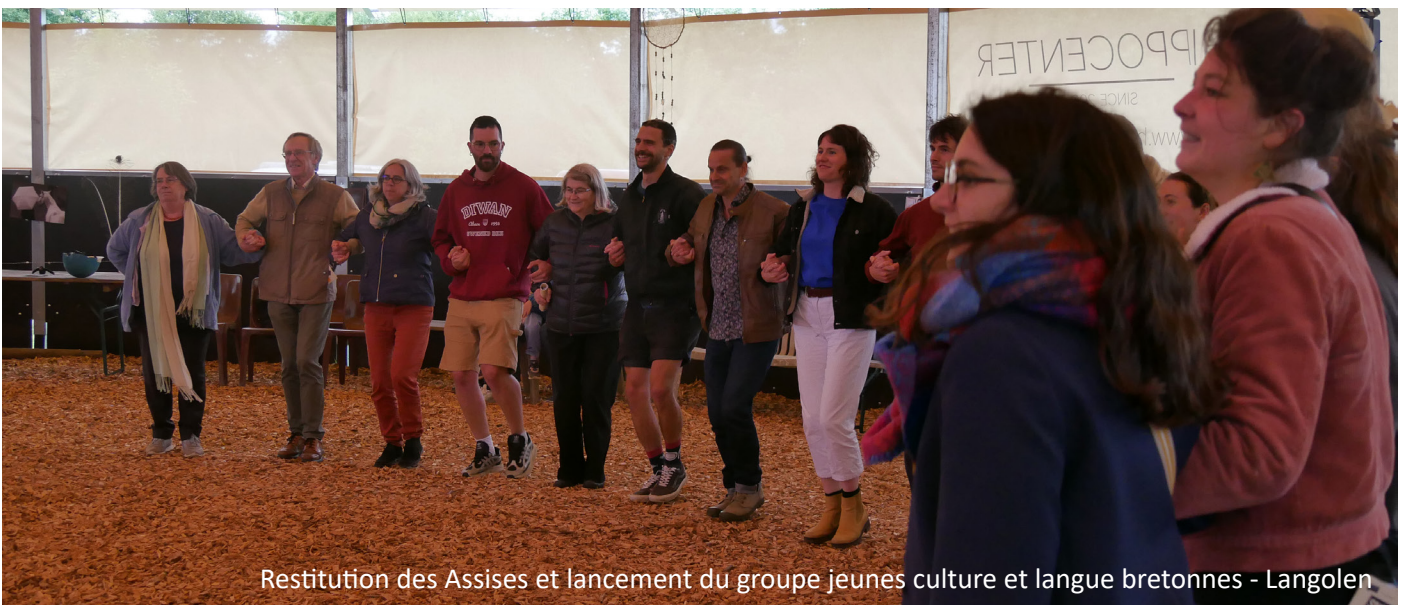
Restitution des Assises et lancement du groupe jeunes culture et langue bretonnes - Langolen

Les Assises ont largement mobilisé le CDC et suscité l'intérêt des acteurs du territoire. Un livret de restitution a également été publié en 2024. Un groupe de travail prospectif réunissant une quinzaine de jeunes du territoire a également été mis en place et se poursuivra tout au long de l'année.