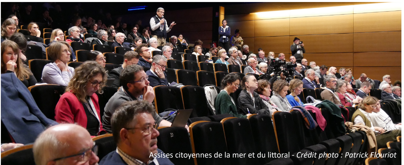
Assises citoyennes de la mer et du littoral

L'édition 2024 était pilotée par le Conseil de développement de Cornouaille et s'est déroulée à Fouesnant, sur le thème de l'éolien en mer.