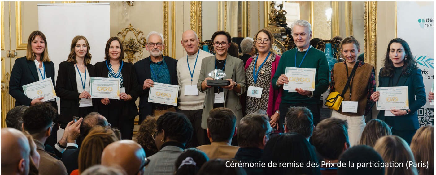
Cérémonie de remise des Prix de la participation (Paris)

22 novembre : Cérémonie de remise des Prix de la participation