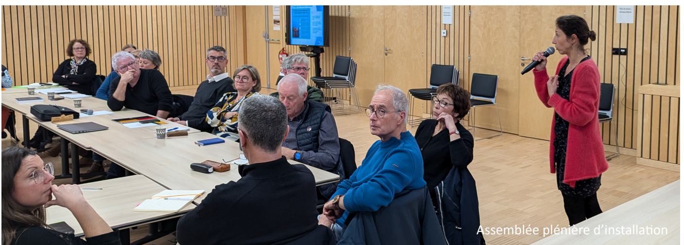
Assemblée plénière d'installation

17 décembre : Assemblée plénière d'installation du CDC