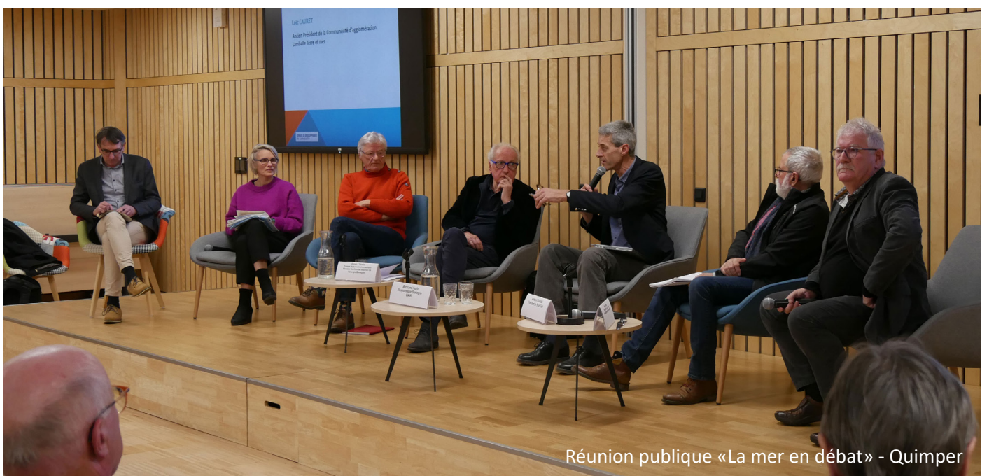
Réunion publique «La mer en débat» - Quimper

Les échanges et propos tenus au cours de la soirée ont été rassemblés dans un cahier d'acteurs transmis à la CNDP, constituant ainsi une contribution de la Cornouaille au débat national.