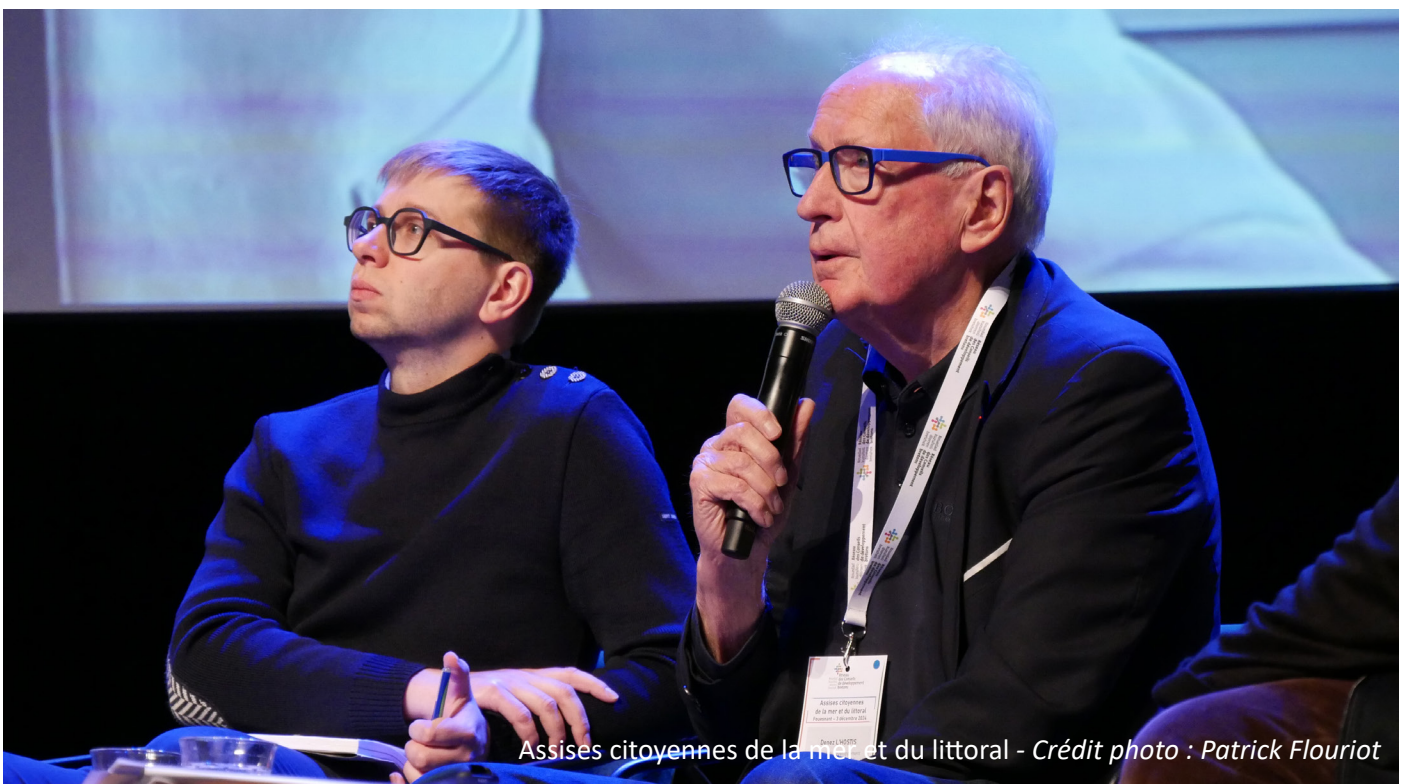
Assises citoyennes de la mer et du littoral

Un évènement majeur : les Assises citoyennes de la mer et du littoral